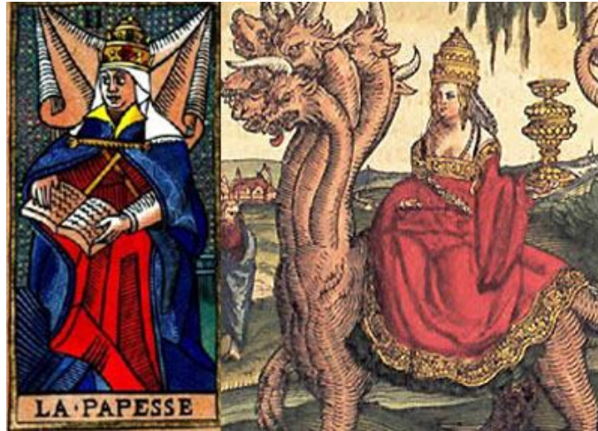
1. ábra Johanna pápanőt tarot kártyán a babiloni paráznaként ábrázolják

A fordító megjegyzése: Ez a kérdés azért fontos a római egyház számára, mivel ő úgy tartja, hogy Péter óta (az első pápa óta) a pápák folyamatosan egymást követték. Mivel Péter férfi volt, így minden utódjának is férfinak kell lennie. Ha történetesen a pápa nő lenne, akkor ez azt jelenti, hogy a pápák sorában szakadás történt, így érvénytelen a pápai apostoli szukcesszió. Másodrészt, ha tényleg létezett is női pápa, akkor ez azt jelenti, hogy a Vatikán képmutatóan lép fel, amikor kijelenti, hogy nem szabad, hogy legyenek női papok, ha már egyszer volt női pápa is.