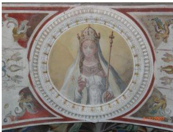
2. ábra Johanna pápanő freskója a San Silvestro kápolnában

Csupán a nicaraguai illetve El salvadori eseményekre kell nézni, hogy meggyőződjünk arról, hogy egy elszánt államhatalom milyen lépéseket tenne annak érdekében, hogy egy hasonló gyalázatos eseményt eltüntessen. Az idő múlásával az igazság mégis feltűnik a köznépi hírek révén. És így is van, a későbbi századokban nagyon sok dokumentáció létezik Johanna pápaságát illetően. Frederick Spanheim, a tudós német történész, aki kimerítő tanulmányt erről a kérdéstről nem kevesebb, mint 500 korabeli dokumentumra hivatkozik, amelyek Johanna pápaságára hivatkoznak, amelybe beletartoznak olyan szerzők művei, mint Petrarch és Boccaccio.