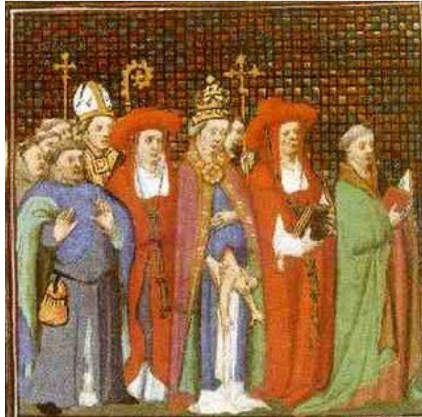
4. ábra Johanna pápanő ábrázolása

utcán szülte meg Johanna pápanő a halvaszületett gyerekét. Hamarosan ezután a pápai vonulások más utat választottak mint a Via Sacra.