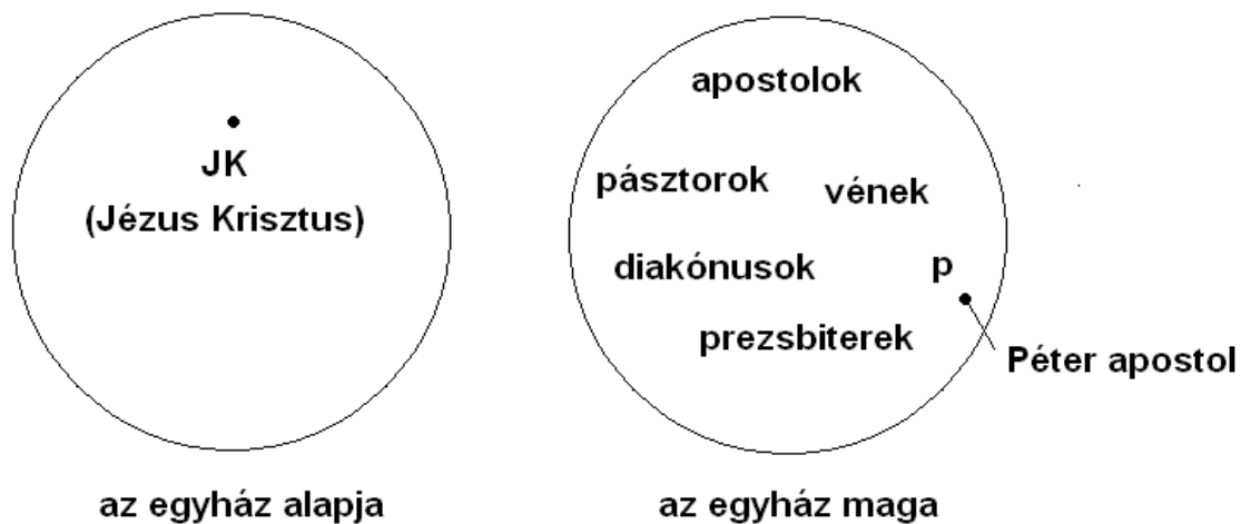
3. ábra az egyház alapja és annak tagjainak halmazbeli diszjunkciója

De nézzük ezt a kérdést egy másik oldalról. Péter az egyháznak a tagja. Ha gráfelméletileg nézzük, Péter eleme az egyháznak, amíg az egyház alapja egy másik dolog; ezek egymástól külön, diszjunkt dolgok. Teljesen ésszerű dolog, hogy egyvalami nem lehet önmaga alapja. Ezért is állítja a Biblia másutt, hogy az egyház sarokköve maga az Úr Jézus Krisztus, a legegységesebb elem és legalapvetőbb alap, amire az egyház maga felépül (lásd 3. ábra). Továbbá Péter azért nem lehet a kőszikla, mivel mára már meghalt, és az ő halálával az egyház alaptalan maradt volna. Ezért sokkal értelmesebb magyarázat, hogy vagy Krisztus, az örökkévaló Maga a Kőszikla, vagy a hit, amit Péter mutatott, amikor Jézus megkérdezte őt arról, hogy Őt kinek gondolja. Ezt a két alternatív magyarázatot számos egyházatya tartotta.